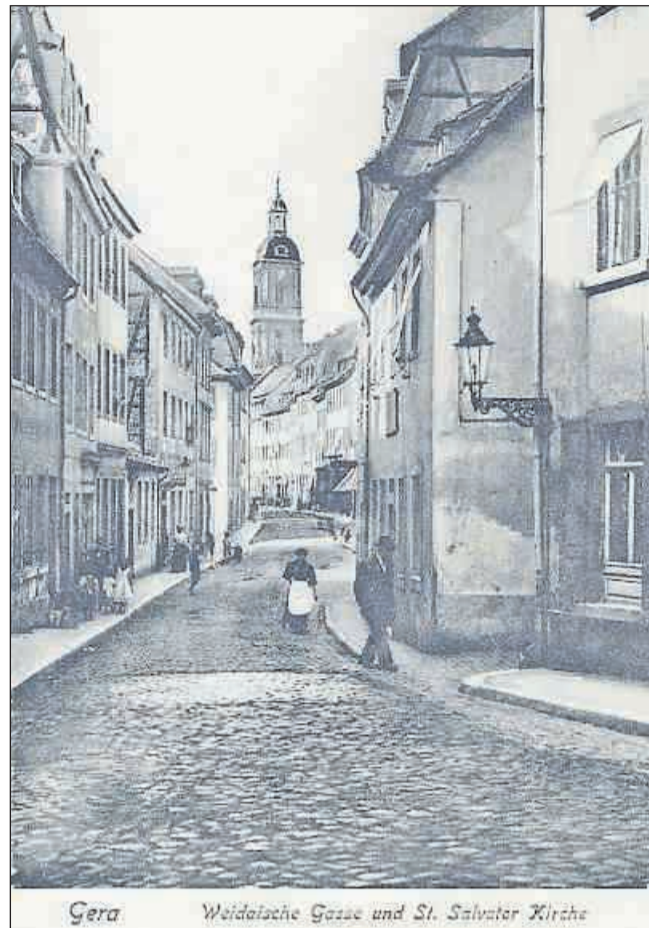
undatierte Postkarte, um 1915.