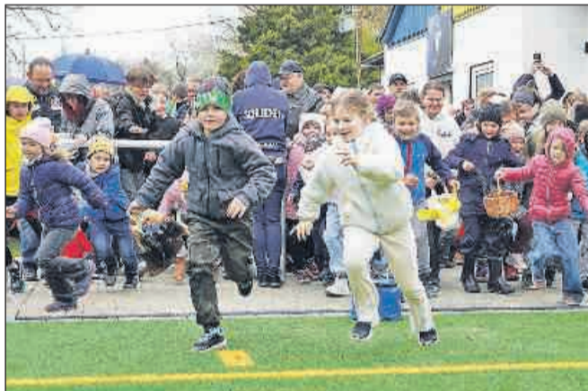
Mit Körbchen und Beuteln ging es im Eiltempo auf die Suche.

Den zahlreichen Kindern hatte es gefallen. Im nächsten Jahr kommen alle bestimmt wieder. Unterdessen bestreitet Fußball-Kreisligist SV Langenberg sein nächstes Heimspiel am Snnabend, 18. April um 14.30 Uhr gegen die SG Gera-Pforten.