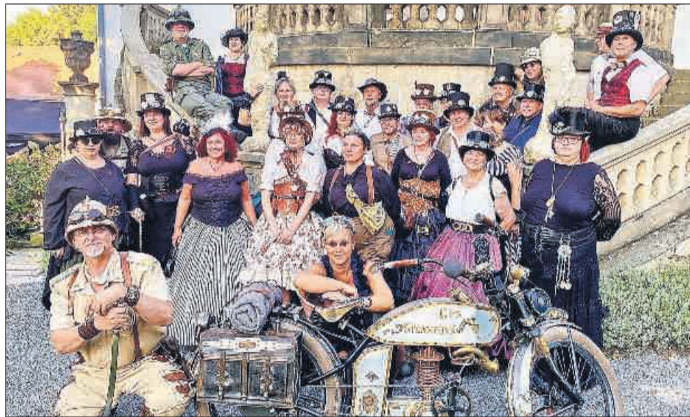
„Mit Zahnrad und Zylinder“ auf dem Hofwiesenparkfest.

Auf jeden Fall wünschen sich die Vereinsmitglieder, viele neue Steampunks zu infizieren, denn in Gera habe Steampunk noch viel Luft nach oben.