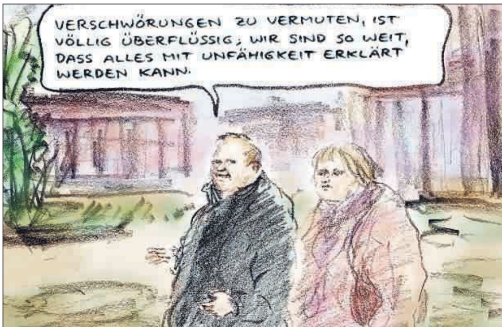
Karikatur: Bernd Zeller