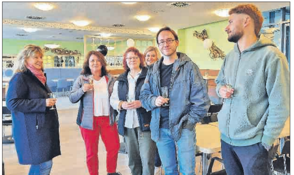
Mitarbeiter der IHK schauen sich wie ebenso andere Gäste in der neuen gepflegten Gastronomieeinrichtung um und freuen sich schon auf geschmacklich gelungene Speisenangebote.

Also liebe Leser, hätten Sie nicht auch mal Lust, in dieser gastronomischen Perle einzukehren?