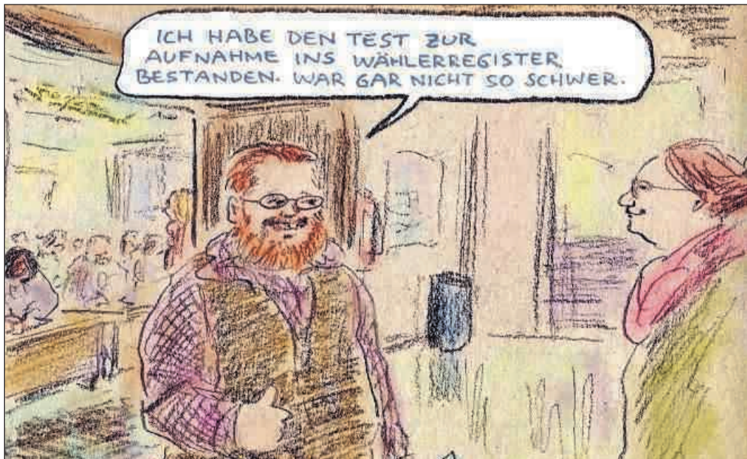
Karikatur: Bernd Zeller