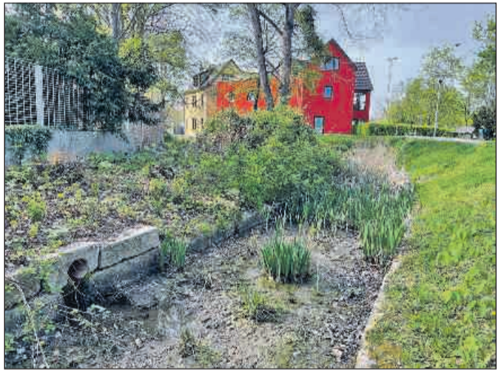
Trostloser Anblick am Hofwiesenzentrum. Früher musste der Müllgraben regelmäßig geschlämmt werden, um die Bildung einer Kloake zu verhindern. Nach der Verrohrung des Fließes gab es immer mal wieder die Idee, den Graben zu fluten. Kein Geld.