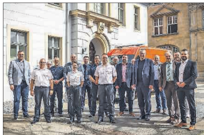
Spitzentreffen im Oberzentrum.

Für die Bürgerinnen und Bürger in Ostthüringen ergeben sich, trotz einer möglichen Neuausrichtung des Landesprojekts, keine größeren Änderungen, da der Leitstellenverbund Ostthüringen bereits mit den Leitstellen in Gera und Jena seine Zielstruktur 2021 erreicht hat. Dennoch ist die Vereinheitlichung und Vernetzung sowie der Ausbau beider Leitstellen dringend erforderlich, damit die beiden Leitstellen auch in 5 oder 10 Jahren noch den