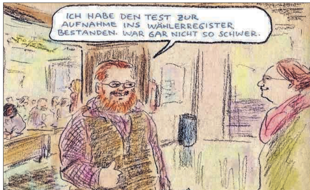
Karikatur: Bernd Zeller