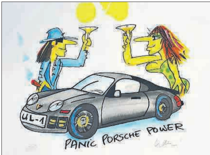
Udo Lindenberg's Panic-Porsche-Power-2022 ist nur ein Bild von 14, das in der Ausstellung zu sehen sein werden.

Heute leben wir mehr und mehr in einer entzauberten Welt. Künstliche Intelligenz und Automatisierung lässt Personen zu einem einzigen Datensatz zusammenschmelzen. Wir hoffen insgeheim, dass das nicht alles sein kann. Deshalb ist wieder Zeit für eine romantische Revoluti-