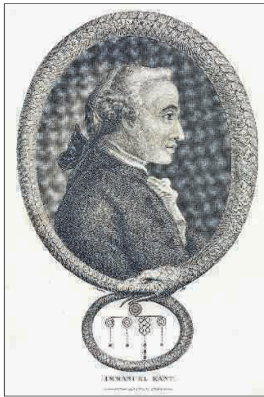
Porträt des Philosophen Immanuel Kant (1724-1804), in einem Rahmen, der von einer Schlange gebildet wird, die sich in den eigenen Schwanz beißt.

Gera (NG). AUFKLÄRUNG ist der Ausgang des Menschen aus seiner selbstverschuldeten Unmündigkeit. Unmündigkeit ist das Unvermögen, sich seines Verstandes ohne Leitung eines anderen zu bedienen. Selbstverschuldet ist diese Unmündigkeit, wenn die Ursache derselben nicht am Mangel des Verstandes, sondern der Entschliebung und des Mutes liegt, sich seiner ohne Leitung eines anderen zu bedienen. Sapere aude! Habe Mut, dich deines eigenen Verstandes zu bedienen! ist also der Wahlspruch der Aufklärung.