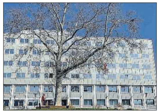
Geraer Bibliothek mit Platane

Gera (NG). Am Dienstag, 23. April von 10 bis 17 Uhr, lädt der Förderverein der Bibliothek wieder zum Bücherflohmarkt vor der Stadt- und Regionalbibliothek unter der Platane ein. Bei schlechtem Wetter findet der Flohmarkt in der Bibliothek statt. Angeboten werden zahlreiche aus Bibliotheksbeständen ausgesonderte Medien: Romane, Kinderbücher und Sachbücher. Alles wird gegen eine kleine Spende abgegeben. Mit den Einnahmen unterstützt der Förderverein „Buch und Leser“ e.V. die Bibliotheksarbeit. In den vergangenen Jahren konnten so vielfältige Leserwünsche erfüllt und Veranstaltungen mitfinanziert werden.