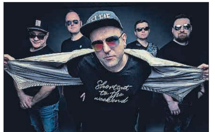
„Biba & die Butzemänner“ verwandeln den gesamten Schloßpark in eine riesige Partymeile.

Neues Gera verlost 3x2 Freikarten für das Zeitzer Lichterfest. Interessenten melden sich bis 26. April per E-Mail unter: anzeigen@verlag-frank.de