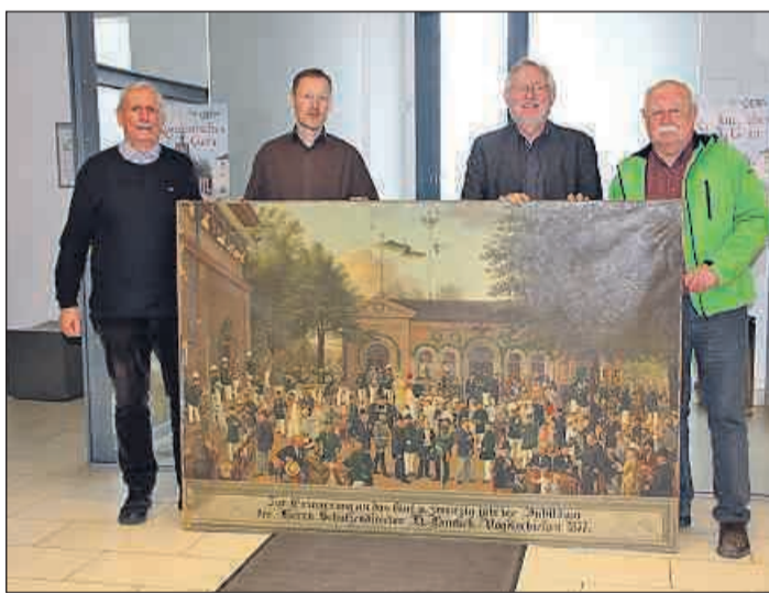
Gebeten wird um Spenden für die Restaurierung von vier historischen Schützengemälden.

Die Motive der Scheiben haben meist einen erstaunlich aktuellen Bezug auf die damaligen politischen und wirtschaftlichen Verhältnisse. Sie bieten interessante