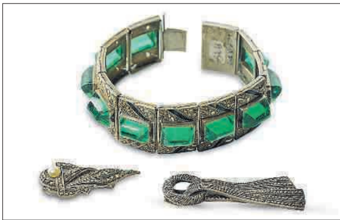
Art déco-Armschmuck, um 1930, unedles Metall, Email, Strass, 19,01 cm x 2,7 cm. Art déco-Brosche, um 1930, Silber, gestempelt DRGM, 4,5 cm x 2,1 cm. Art déco-Kleiderbrosche, um 1932, 935 Silber, Makasite, 6 cm x 2,2 cm

Gera (NG). Schmuckstücke, die aktuelle Modetrends aufgreifen, sind heute ganz selbstverständlich in jeder Garderobe zu finden. Die Erfolgsgeschichte des „unechten“ Schmucks begann vor mehr als 100 Jahren, zunächst als ein Surrogat, dann als Ausdruck von Modernität. Auf der Weltausstellung des Kunstgewerbes in Paris im Jahr 1925 stellten Schmuckhersteller aus ganz Europa ihre Kreationen vor. Darunter waren etliche Geschmeide, die nicht aus Perlen, Gold und Silber gefertigt waren, sondern aus unkonventionellen Materialien wie etwa Celluloid, Nickel oder Glas. Durch die Materialnot, die mit dem Ende des Ersten Weltkriegs aufkam, stand den Gold- und Silberschmieden in der Weimarer Republik nur wenig Edelmetall zur Verfügung. Das Einschmelzen von Silbermünzen für Schmuck war sogar verboten. Doch war die Zeit zwischen den Weltkriegen nicht nur von Verzicht geprägt: Eine aufstrebende Mittelschicht, zu der auch die selbstbewusste »neue Frau« gehörte, wollte sich über Kunst und Mode neu definieren. Gabrielle „Coco“ Chanel erfand passend dazu nicht nur ein revolutionäres Kleid, das „kleine Schwarze“, sondern machte auch den Modeschmuck in den 1920er Jahren chic und gesellschaftsfähig. Schmuck, der einst elitär und unerschwinglich war, konnte nun fast jedermann und jede Frau erwerben. Der Smaragd, in natura sehr teu-