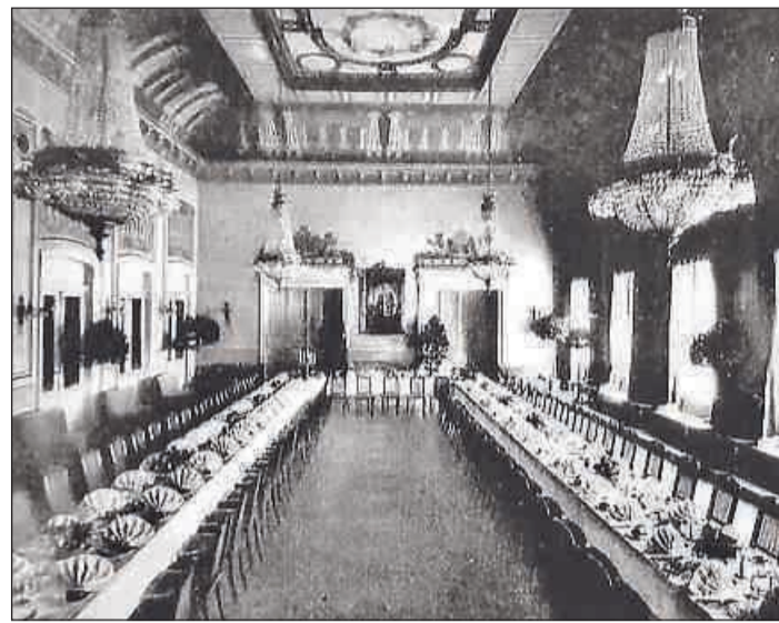
Festsaal im Deutschen Haus um 1925