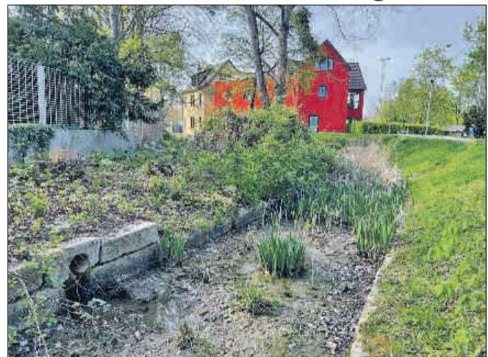
Trostloser Anblick am Hofwiesensparkplatz. Früher mußte der Mühlgraben regelmäßig geschlämmt werden, um die Bildung einer Kloake zu verhindern. Nach der Verrohrung des Fließes gab es immer mal wieder die Idee, den Graben zu fluten. Kein Geld.